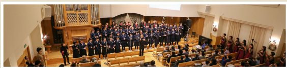
第6回 市民クリスマスコンサート2017